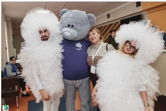
Встреча гостей форума