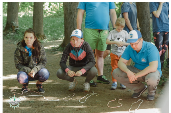
Конкурс морских узлов