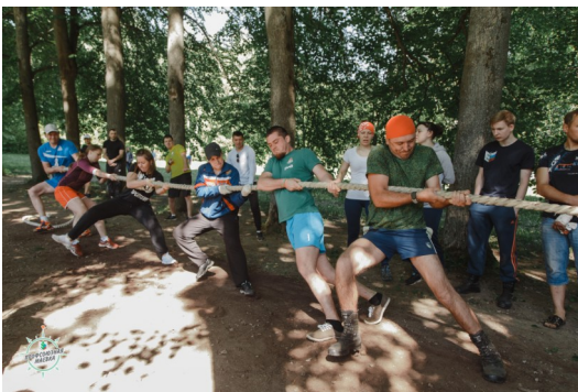
Конкурс «Перетягивание каната»