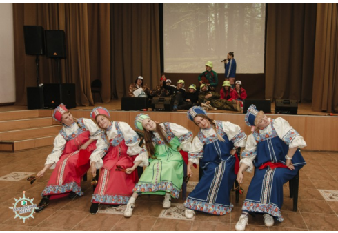
Команда Орехово-Зуевской РО

МАЁВКА - это, в первую очередь, соревнования, но где, если не здесь можно отдохнуть душой, получить заряд бодрости и вдохновения, встретить старых друзей и завести новые знакомства?