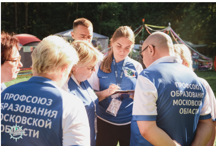
Совещание судей аппарата МООП

3 место – Павлово-Посадская районная организация.