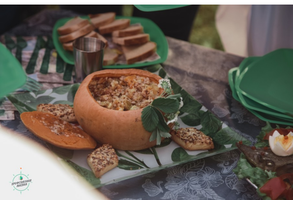
Конкурс «Туристская кухня»