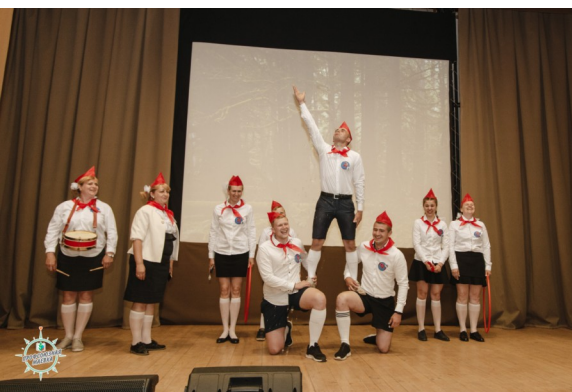
Конкурс «Визитная карточка»

Хочется отметить, что база проведения слёта впечатляет своей душевностью и гостеприимностью. Организаторы позаботились и о дровах, и о питьевой воде. Но больше всего запомнилось общение с людьми, то ощущение тепла и уюта, которое ни на минуту не оставляло при общении с ними.