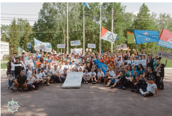
Команды и организаторы МАЁВКИ-2019

Говорят, Профсоюз объединяет. И это правда. Именно это и произошло на Профсоюзном тур слете. Профессиональные союзы молодых педагогов Московской области объединились, чтобы побеждать, чтобы отдыхать и встретиться с друзьями и приобрести новых. Хотелось бы, чтобы в следующем году молодых профсоюзников на Слете стало еще больше: не только работники образовательных организаций, но и студенты педагогических вузов.