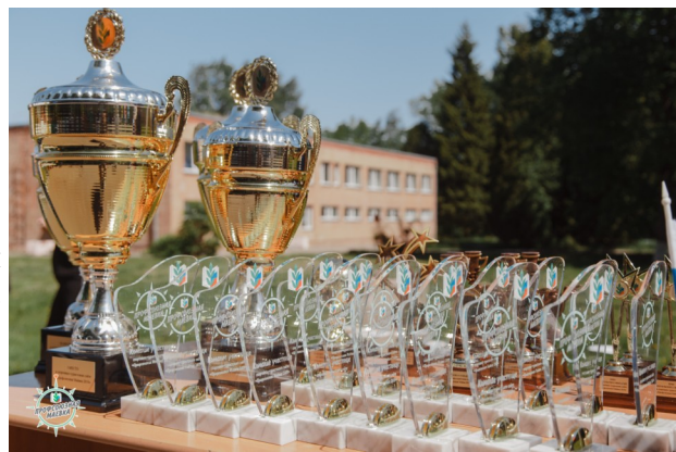
Памятные кубки и награды для всех участников слёта «Профсоюзная маёвка»

В этом году в соревнованиях приняли участие 18 команд представляющих местные организации Профсоюза – Волоколамская районная, Долгопрудненская городская, Домодедовская городская, Железнодорожная городская, Истринская районная, Клинская районная, Коломенская городская,